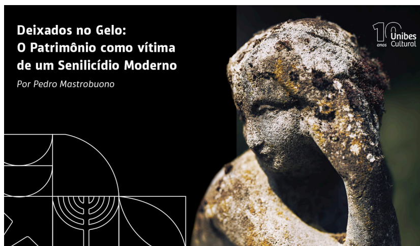
Artigo sobre patrimônio histórico e cultural, de autoria de Pedro Mastrobuono