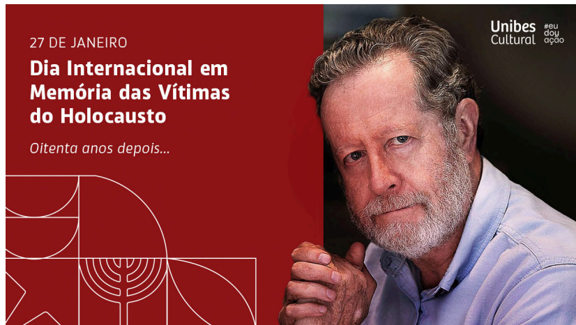
Artigo sobre Dia em Memórias das Vítimas do Holocausto, de autoria de Marcio Pitliuk