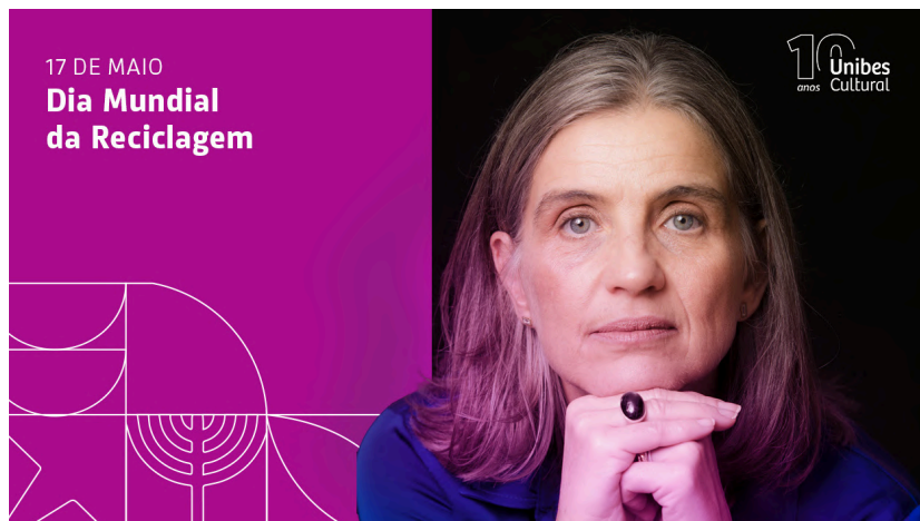
Artigo sobre a nova Lei de Incentivo à Reciclagem no Brasil, de autoria de Cris Olivieri.